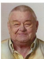
Der Tod ist das Tor zum Licht am Ende eines mühsam gewordenen Weges.

Bestattungsinstitut Beatrix Schottenbaum