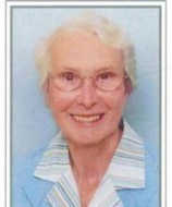
Gute Mutter, tausend Dank am Grabe, für alle Deine Mühe, Sorg und Plage, nun ruhen die fleißigen Mutterhände, die tätig waren bis ans Ende.

vorbereitet durch ein christliches Leben und die Sakramente der Kirche.