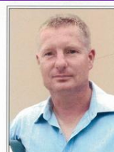
Mei Leben is z'End, missus aus meim Haus, Pflaß auch missinand, I geh grad voraus. I geh grad voraus und woa's a Weil, bis es noch kemms - hod oba kos Essl.

Bestattungsinstitut Raab Hausenberg Tel. 08386 / 1424