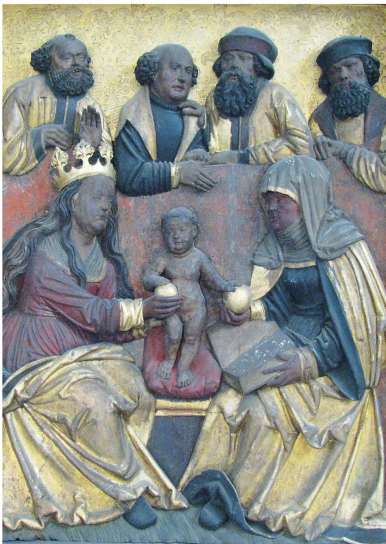
Kaufmannskirche, Erfurt

Aus Anlass des Gedenktages von Anna und Joachim am 26. Juli, den Eltern Marias und Großeltern Jesu, feiert die katholische Kirche am 24. Juli zum zweiten Mal den Welttag der Großeltern und Senioren. Jesus wird Mensch in einer großen Familie: Josef und Maria, Anna und Joachim, Kleophas und Salomas, die späteren Ehemänner von Anna nach dem Tode Joachims.