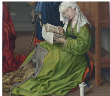
Rogier van der Weyden (1399–1464), Lesende Maria Magdalena

Am 22. Juli hat Maria Magdalena ihr Fest. In der Bibel begegnet sie uns als eine der Jüngerinnen, die Jesus nachfolgen. Und sie wird zur Erstzeugin von Ostern, zur „Apostelin der Apostel“, weil sie den Jüngern die Botschaft von der Auferstehung Jesu verkündet.